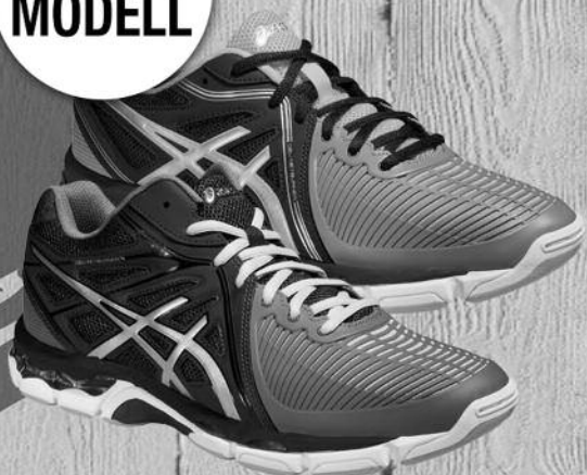
Asics Gel-Netburner Ballistic

JETZT EINES UNSERER TOPMODELLE VORBESTELLEN UND ASICS T-SHIRT + 3er PACK SOCKEN GRATIS SICHERN!