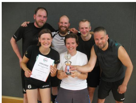
Die Kolleginnen und Kollegen der Fritz-Winter-Gesamtschule Ahlen

Im Schuljahr 2017/18 gingen Lehrerteams von 37 Schulen in NRW an den Start. Über regionale Vorrundengruppen qualifizierten sich 9 Teams für das Finalturnier in Hamm. Zu Gast bei der Friedensschule Hamm kämpften die Gruppensieger der Vorrunden um den Titel „Lehrer-Volleyball-Meister 2018“.