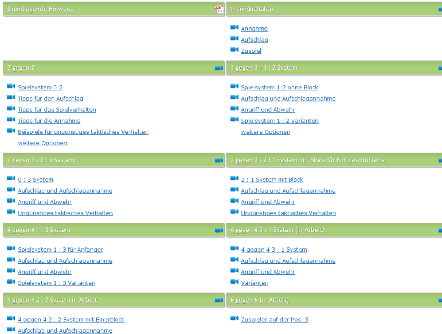
Abb. 1 Gesamtdarstellung des Taktik - Bausteins